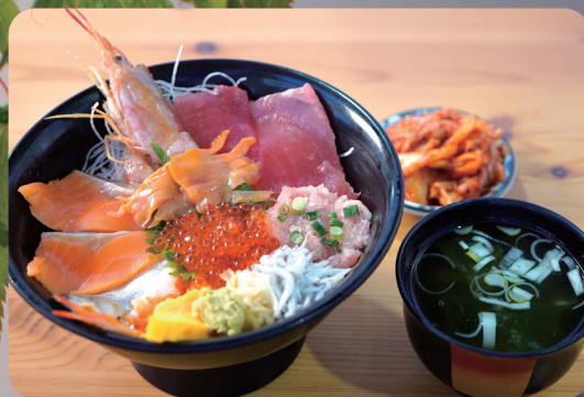
海鮮亭の海鮮丼 1,500円