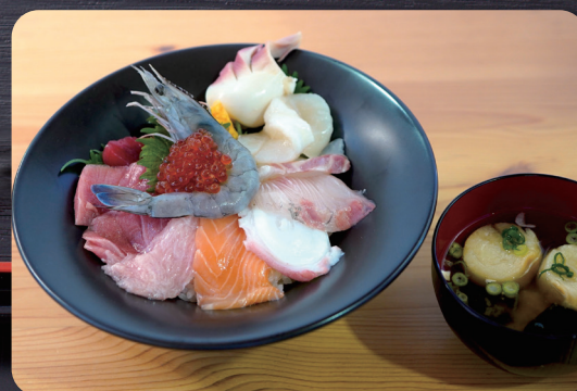
ひふみの海鮮丼 2,500円

店長おすすめ！カニ棒、赤貝、ウニ、北海道産の鮭、いくら 鮮度抜群な高級食材入り。味噌汁と本場のキムチ付き