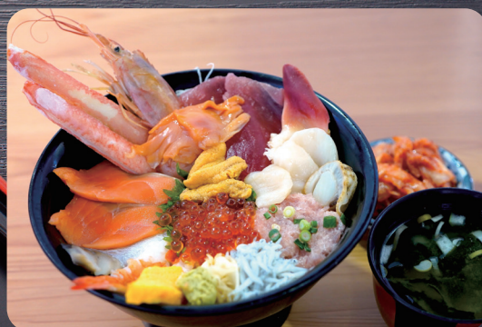
豪快贅沢海鮮丼 2,500円

店長おすすめ！カニ棒、赤貝、ウニ、北海道産の鮭、いくら 鮮度抜群な高級食材入り。味噌汁と本場のキムチ付き