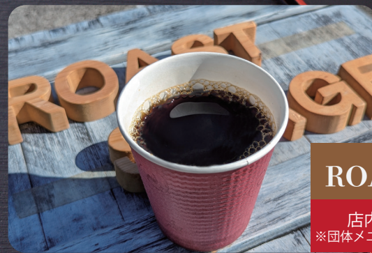
ROAST STAGE 300円

営業時間 10:00~16:00 ランチタイム 11:00~14:00 定休日 木曜日