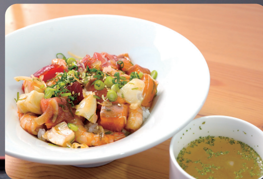
ひふみのポキ丼 1,500円