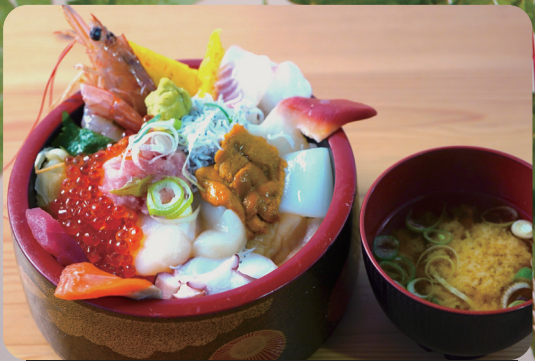
千屋のこぼれ丼 1,500円