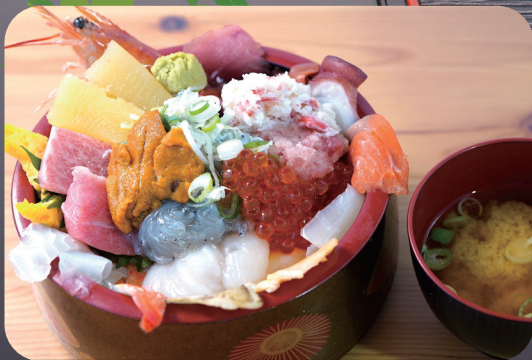
千屋のメガ盛り丼 2,500円

店内で自家焙煎した自慢のCoffee ※団体メニューをご注文いただいたお客様のみご注文可能